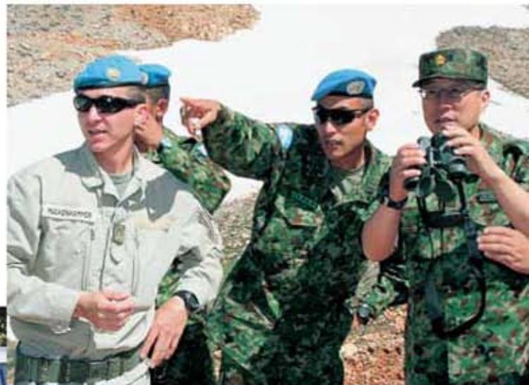
国連兵力引き離し監視隊(UNDOF)の司令部要員