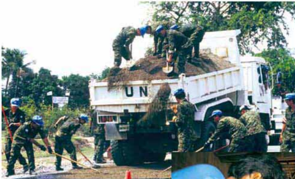
国道3号線の補修作業