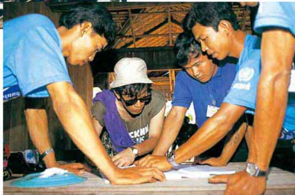
政党代理人を交え不正の有無を確認