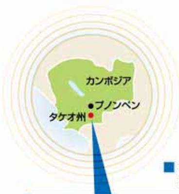
■ 我が国選挙要員 配置図(タケオ州)