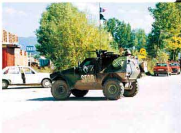
警戒中の治安車両

選挙管理要員は、選挙規則が遵守されているかどうかを監督したほか、必要に応じて投票所委員会委員長に対して改善の申し入れ等を行いました。