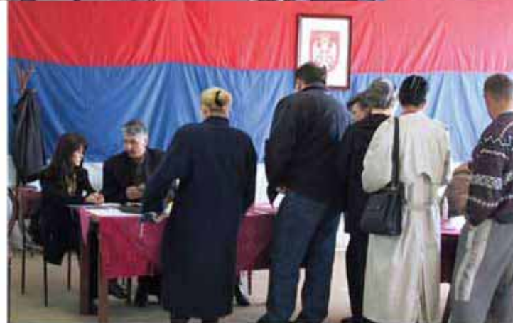
投票所で助言を行う我が国要員