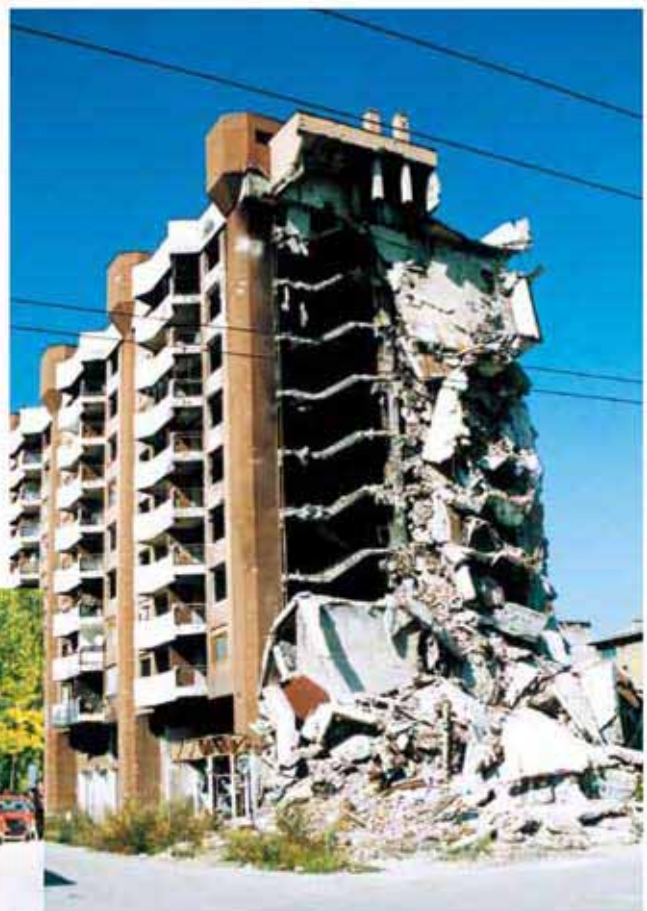
紛争で破壊された建物