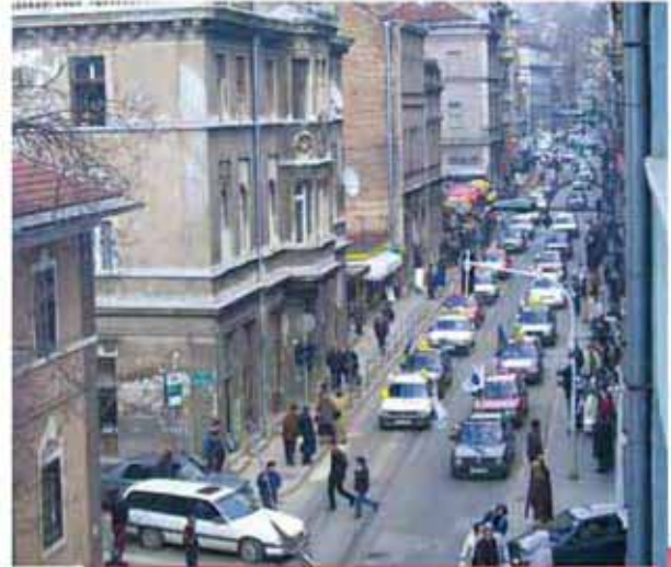
選挙キャンペーンの様子(サラエボ市)